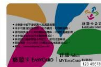
特製版悠遊卡卡號共 10 碼