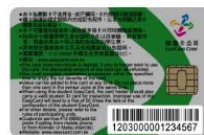
新一代學生悠遊卡卡號共 16 碼