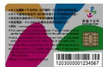
晶片悠遊卡卡號共 16 碼